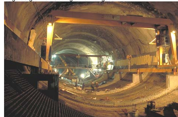
Engelbergtunnel: Bewehrungsarbeiten am Sohlgewölbe