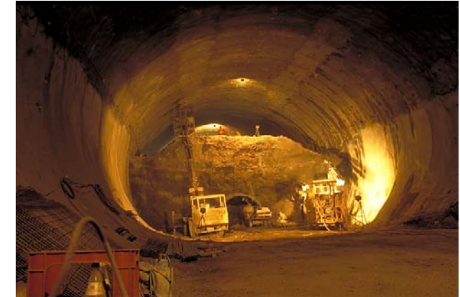
Engelbergtunnel: Strossen- und Sohlvortrieb