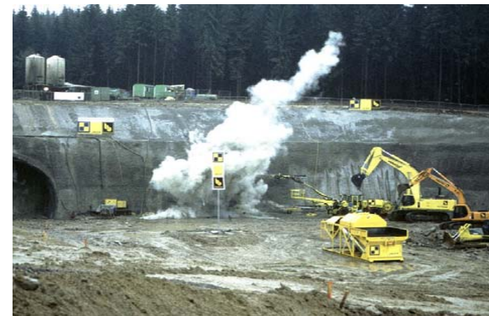
Tunnelanschlag am 16.09.1998

Projekt: Hochwald Tunnel, Kammquerung Thüringer Wald Ort: BAB A71 Erfurt - Schweinfurt Land: Deutschland Auftraggeber: DEGES Deutsche Einheit Fernstraßenplanungs- und -bau GmbH, Berlin Nutzung: Straßentunnel Daten: 2 Röhren, Länge: 1.058 km, Ausbruchsquerschnitt: 83 m 2