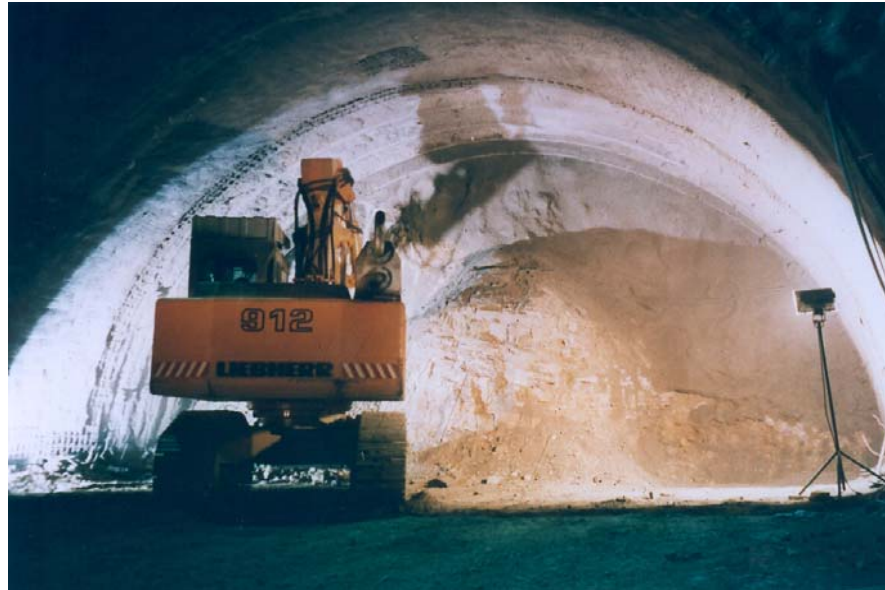
Baggervortrieb im Kalottenquerschnitt